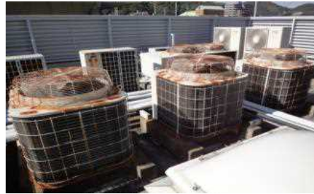
さび・劣化が激しい