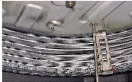
15年以上使用している