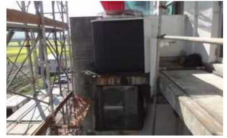
異音が発生している