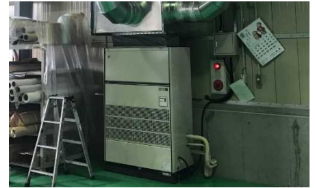
明らかに風量が衰えている

空調機・エアコンの定期メンテナンスは、工場の生産性維持、従業員の快適性向上、そして空調機・エアコンの長寿命化に不可欠です。