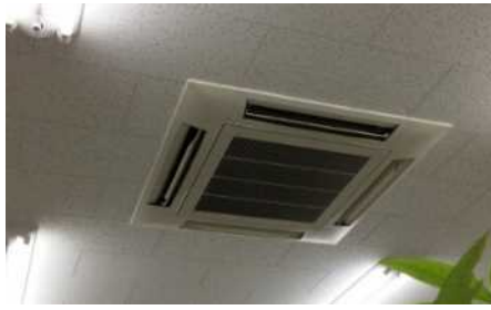
送风口から異臭がする