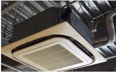
風が温まらない(冷えない)